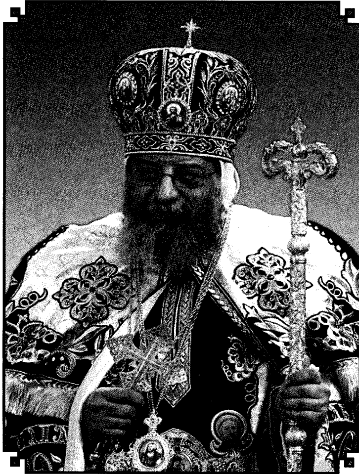
صاحب الغبطة والقداسة البابا المعظم الأنبا تواضروس الثاني بابا الإسكندرية وبطريك الكرازة المرقسية (١١٨)

أسم الكتاب : القمص تادرس السريانى الكنز المخفى